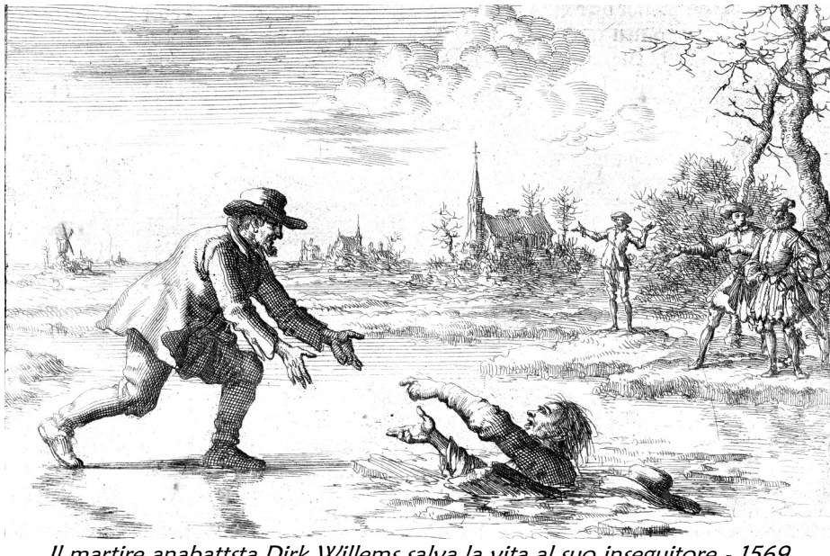
Il martire anabattista Dirk Willems salva la vita al suo inseguitore - 1569

In vista del 2025 si è costituito un gruppo informale di donne e di uomini di fede, al di là degli steccati denominazionali, che vuole ricordare un movimento che ha contribuito ai mutamenti del Cristianesimo e della società moderna. Oggi, in un tempo di crisi della fede, i forti richiami della tradizione anabattista ad una fede matura, impegnata, vissuta all'interno di comunità di donne e uomini consacrati, e che osa agire per la trasformazione nonviolenta delle relazioni personali e sociali, il contributo ecumenico dell'Anabattismo può diventare patrimonio di tutti e di tutte.